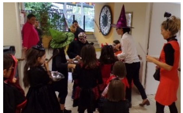
Halloween à la résidence avec les enfants