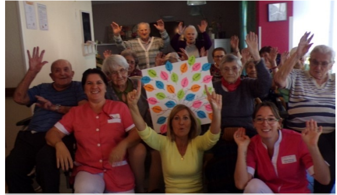
Arbre de la vie