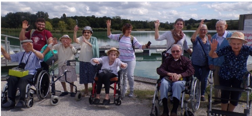
Sortie à la base de loisir