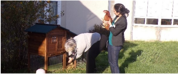
Bienvenue de nos poules Zoe et Mielle