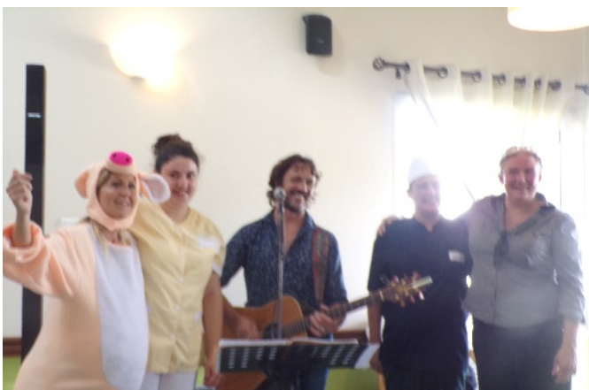
La Fête de la Cochonnaille