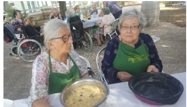
Concours inter résidence Pâtisserie