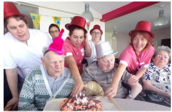
les Anniversaires du mois