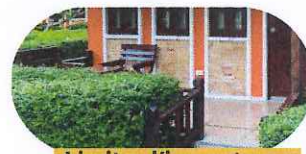
Limiter l'importance des haies et les éloigner des bâtiments.