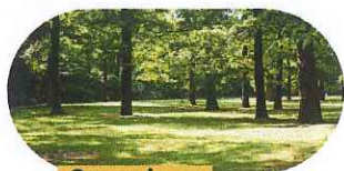
Supprimer les arbustes sous les arbres.