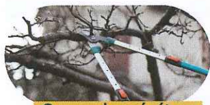
Couper les végétaux et branches des arbres et arbustes proches des constructions.