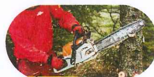
Élaguer les arbres conservés.