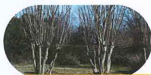
Couper les branches des arbres afin que les arbres ne se touchent pas entre eux.