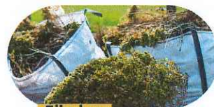
Éliminer les déchets en déchetterie.

Si les premiers travaux de débroussaillage comportent souvent de l'élagage et peuvent nécessiter d'abattre certains arbres, une fois réalisés, les travaux suivants correspondent surtout à de l'entretien