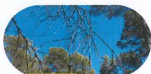
Couper les arbustes morts et les branches sèches.