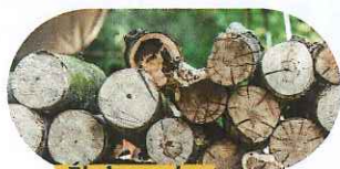
Éloigner les réserves de bois ainsi que tout autre stock de combustible des constructions.