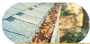
Nettoyer les gouttières et les toits pour les débarrasser des feuilles et aiguilles de pin.